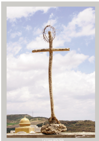
La Croce della fede