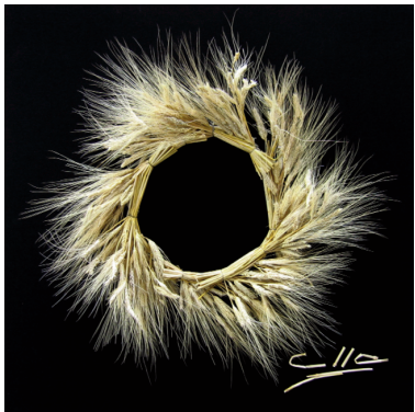
Aureola di luce dorata